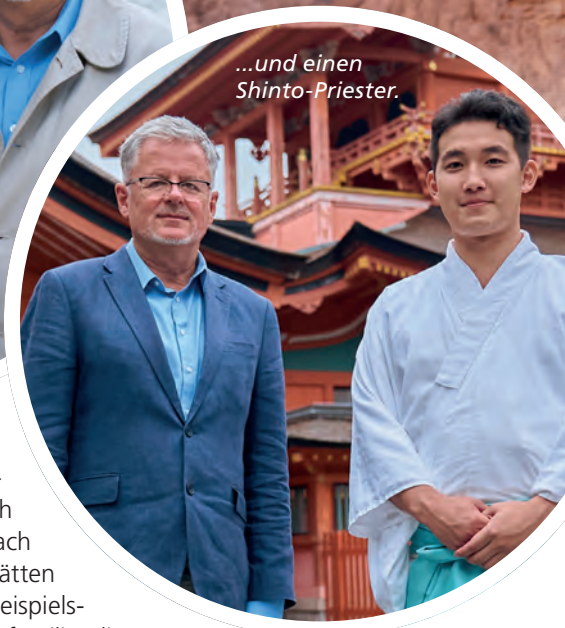
...und einen Shinto-Priester.

schen Behörde ange stellt. Es sind aber auch Menschen, die einfach nur in der Nähe der Stätten wohnen. So hat uns beispielsweise eine kleine Mayafamilie, die unweit des Palenque-Tempels lebt, von ihren religiösen Gefühlen erzählt.