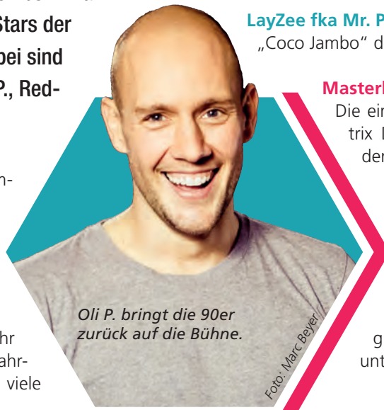
Oli P. bringt die 90er zurück auf die Bühne.

Am ersten Wochenende im September verwandelt sich das Deutsche Eck in Koblenz in eine Festivalmeile. Nachdem Wincent Weiss mit seinem Konzert am Donnerstagabend eröffnet, folgt freitags mit Silbermond direkt das nächste Highlight. Am Samstag, 2. September um 17 Uhr startet dann die Zeitreise in das bunte Jahrzehnt der 90er Jahre. Mit dabei sind viele bekannte Gesichter.