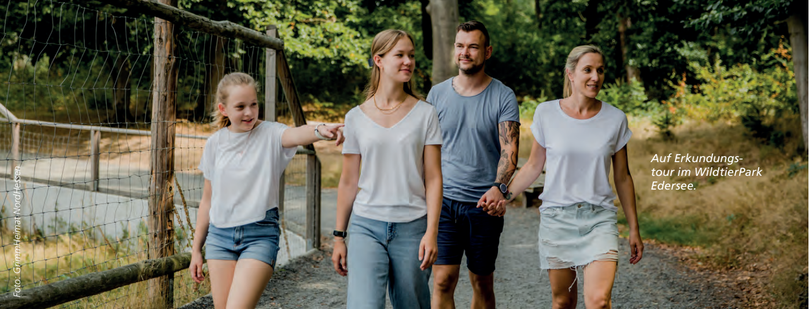
Auf Erkundungstour im WildtierPark Edersee.