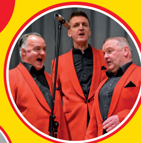
Die Mainzer Hofsänger