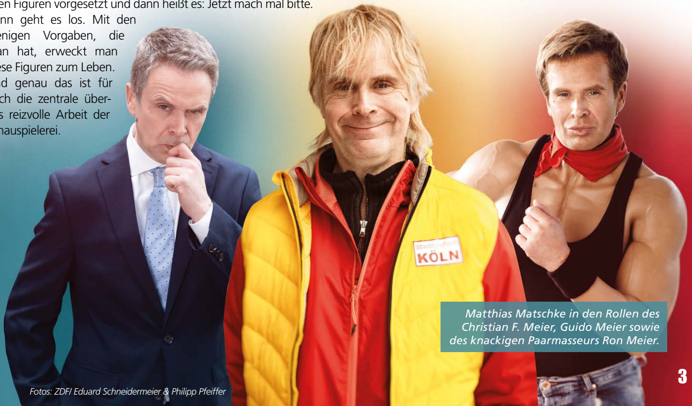
Matthias Matschke in den Rollen des Christian F. Meier, Guido Meier sowie des knackigen Paarmasseurs Ron Meier.