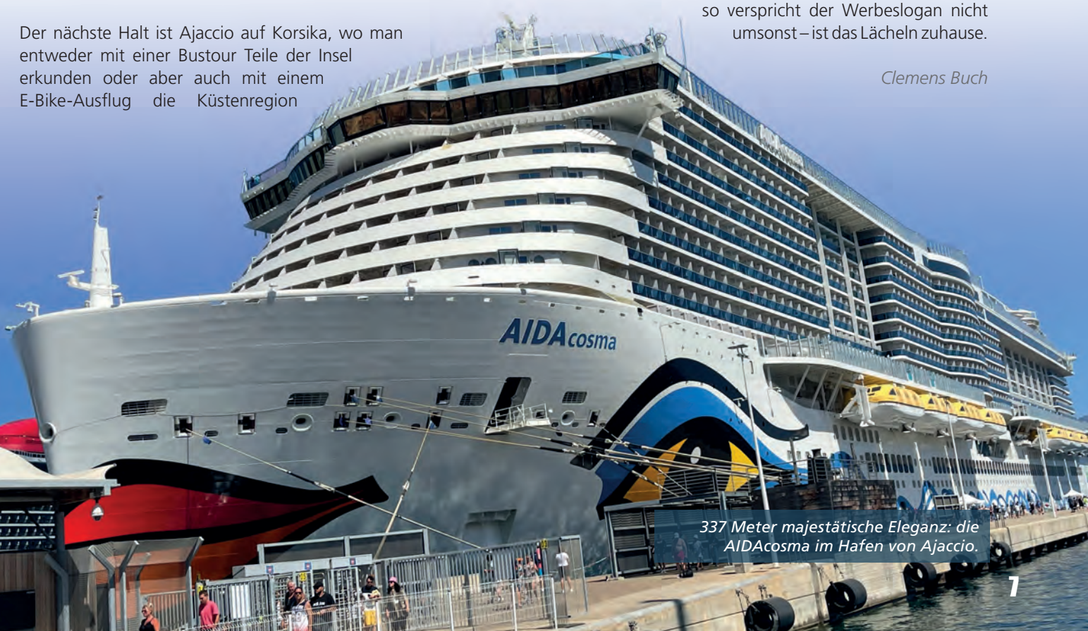
337 Meter majestätische Eleganz: die AIDAcosma im Hafen von Ajaccio.