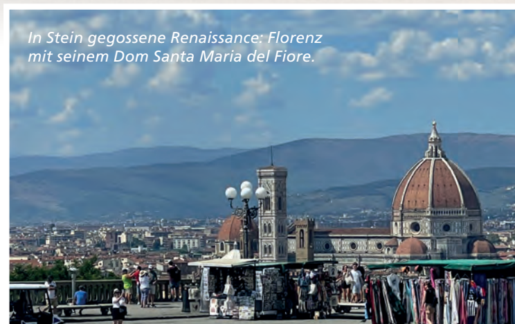
In Stein gegossene Renaissance: Florenz mit seinem Dom Santa Maria del Fiore.

Architektonisches Meisterwerk: der Schiefe Turm von Pisa.