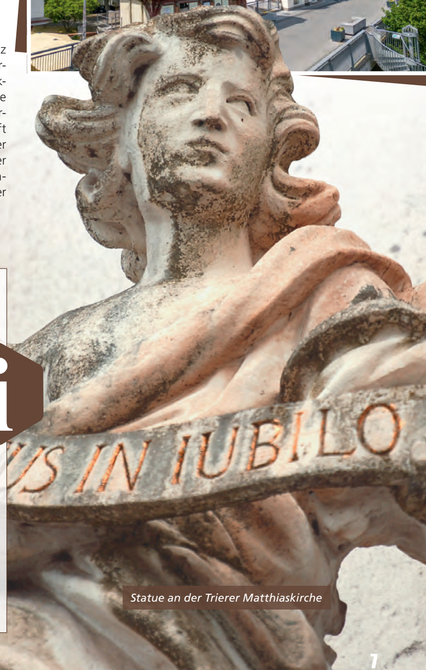
Statue an der Trierer Matthiaskirche