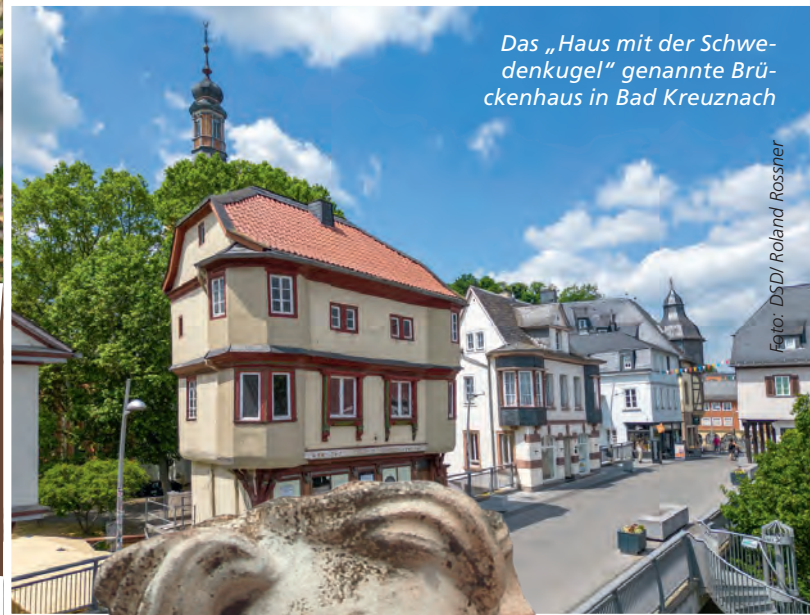
Das „Haus mit der Schwedenkugel“ genannte Brückenhaus in Bad Kreuznach

Das Förderprogramm der Deutschen Stiftung Denkmalschutz umfasst private und öffentliche Denkmale, darunter Bürgerhäuser, Burgen, Kirchen, Klöster, Schlösser, technische Denkmäler, aber auch archäologische Grabungen und historische Grünanlagen. Nur durch die tatkräftige Mithilfe vieler Mitbürger lassen sich diese Kunstschatze unserer Kulturlandschaft erhalten. Die Förderung durch die DSD versteht sich daher immer auch als Anerkennung des beispielhaften Bemühens der Denkmaleigentümer, Fördervereine, Kommunen und Gemeinden in ihrem Einsatz für den kulturellen Erinnerungsschatz, der uns allen Heimat bewahrt.