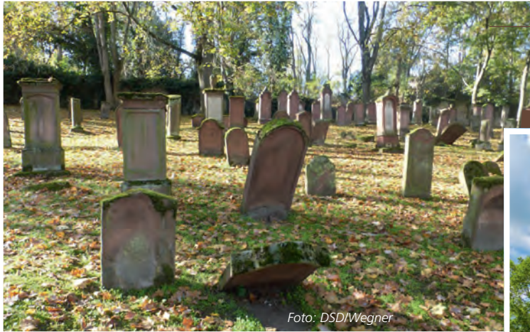
Der Alte Jüdische Friedhof in Mainz gehört zu den ältesten seiner Art in Europa.