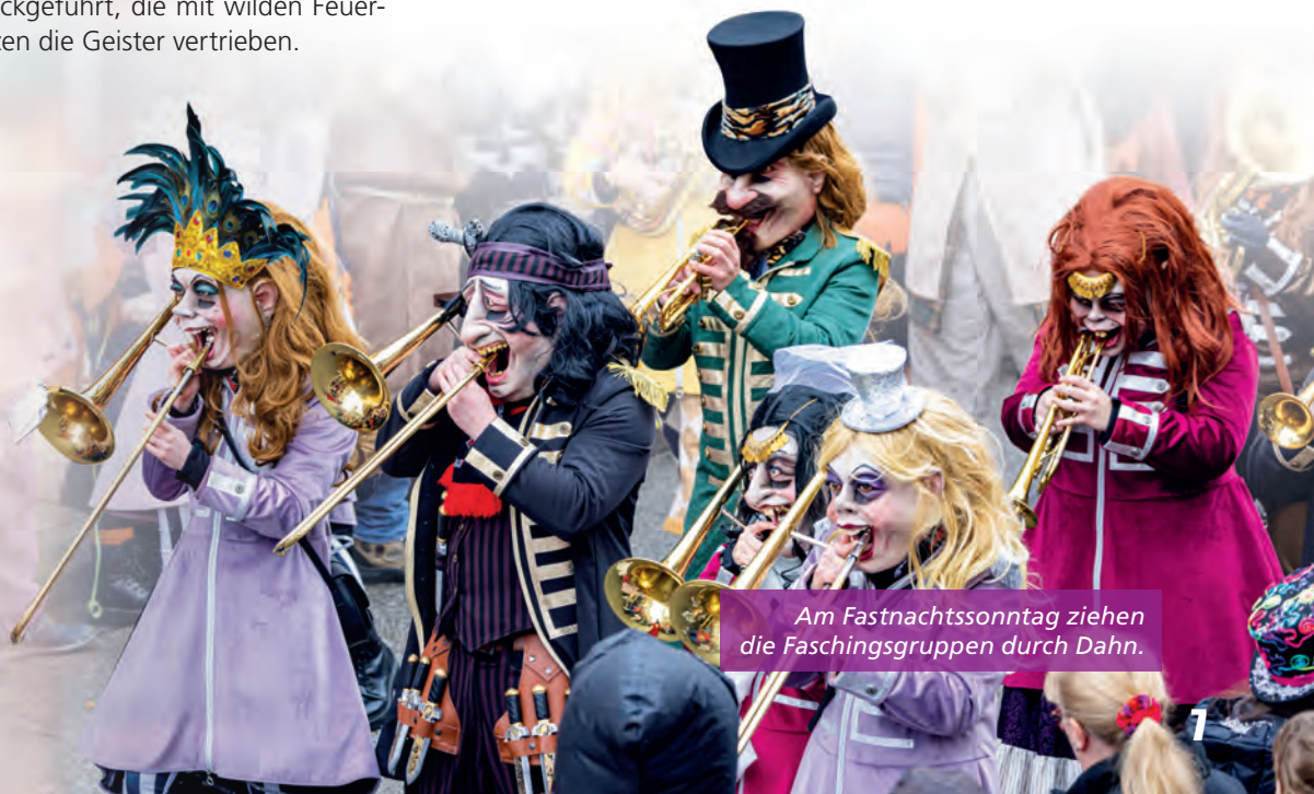
Am Fastnachtssonntag ziehen die Faschingsgruppen durch Dahn.