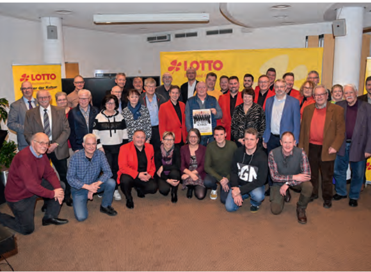
In Koblenz trafen sich die Organisatoren der 15 Benefizkonzerte, die die Mainzer Hofsänger im Jahr 2024 in Kooperation mit Lotto Rheinland-Pfalz geben werden.

Im Jahr 2007 wurde die Partnerschaft zwischen den Mainzer Hofsängern und Lotto Rheinland-Pfalz begründet und ist seitdem stetig gewachsen. Seit dieser Zeit arbeitet das Glücksspielunternehmen mit dem beliebten Chor zusammen, um überall in Rheinland-Pfalz Menschen zu helfen.